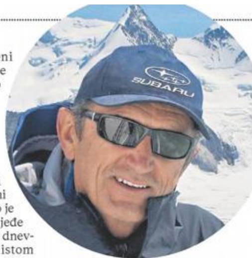
Stipe Božić prvi je Hrvat koji se popeo na najviši svjetski vrh

Moguće je. Zato i imamo Hrvatske šume, one njima gospodare. Hrvatske šume se opravdavaju da ne mogu održavati površine u privatnom vlasništvu. Čovjek nije vlasnik šume. Čovjek je vlasnik zemljišta. Po zakonu, ne možete samo tako na svojoj zemlji posjeći stablo, trebate za to dopuštenje šumara. Vidjeli smo da kad šuma izgori ostaju terase, nekad su to bile obradive površine. Ne kažem da ih sve trebamo ponovo obrađivati, ali mo-